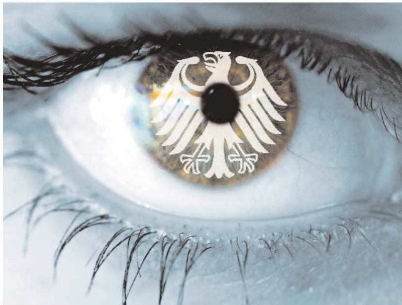
Augen auf: Wenn die Erinnerung allein vom Staat verwaltet wird, kommt ihr das zivilgesellschaftliche Fundament abhanden.

Warum sich die Erinnerungskultur in Deutschland in eine falsche Richtung entwickelt