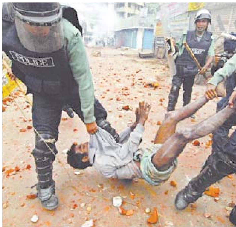
Polizeieinsatz am 21. November in Kalkutta